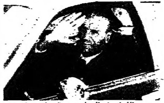
الرئيس سرّيس مع وفد الجبهة اللبنانية في بيروت